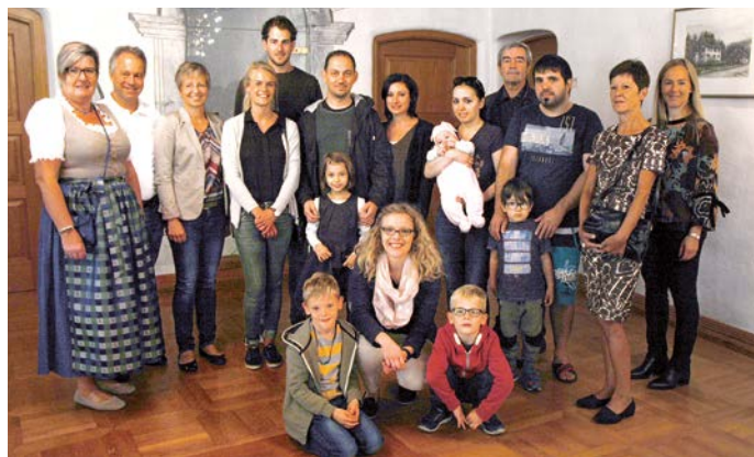
Willkommen in Röthis!

Nach dem gegenseitigen Vorstellen der TeilnehmerInnen und der GemeindevertreterInnen wurde in lockerer Atmosphäre geredet und Röthner Wein vom Weingut Nachbar verkostet. Anschließend wurden die neu Zugezogenen zum Essen und Trinken auf den Dorfmarkt eingeladen.